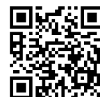
学生申込 グーグルフォーム