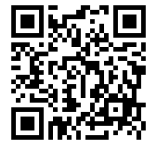
事業所申込 グーグルフォーム

グーグルフォーム： https://forms.gle/ZSjbtkV53YsSB2hWA