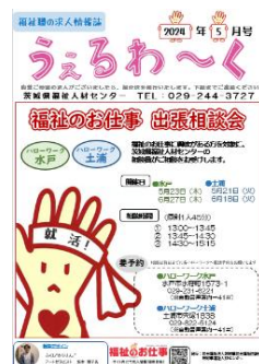
県内の情報がたくさん！