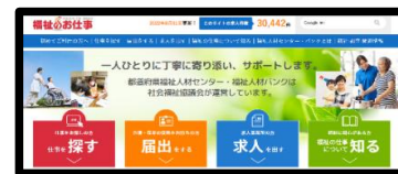
福祉のお仕事ホームページ

※ 求職登録後、希望する方には毎月 1 回、福祉の求人情報誌「うえるわ〜く」を郵送します。