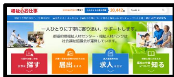
福祉のお仕事ホームページ