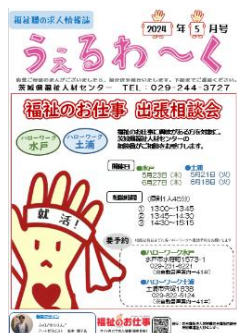
県内の情報がたくさん！

※ 求職登録後、希望する方には毎月 1 回、福祉の求人情報誌「うえるわ〜く」を郵送します。